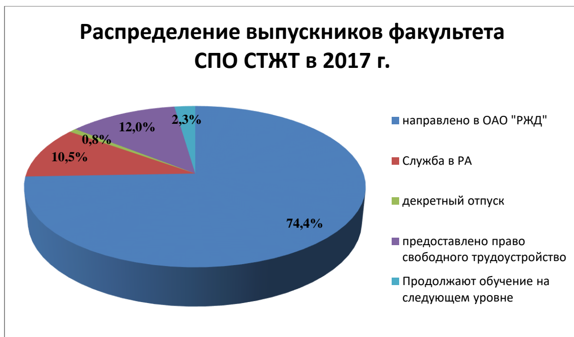
Рис.2 Распределение выпускников ФСПО-СТЖТ, %

Успешному решению вопросов распределения и трудоустройства выпускников способствовало тесное взаимодействие факультета с отделами кадров служб дороги и обособленных структурных подразделений – филиалов ОАО «РЖД», основанное на договорных отношениях.